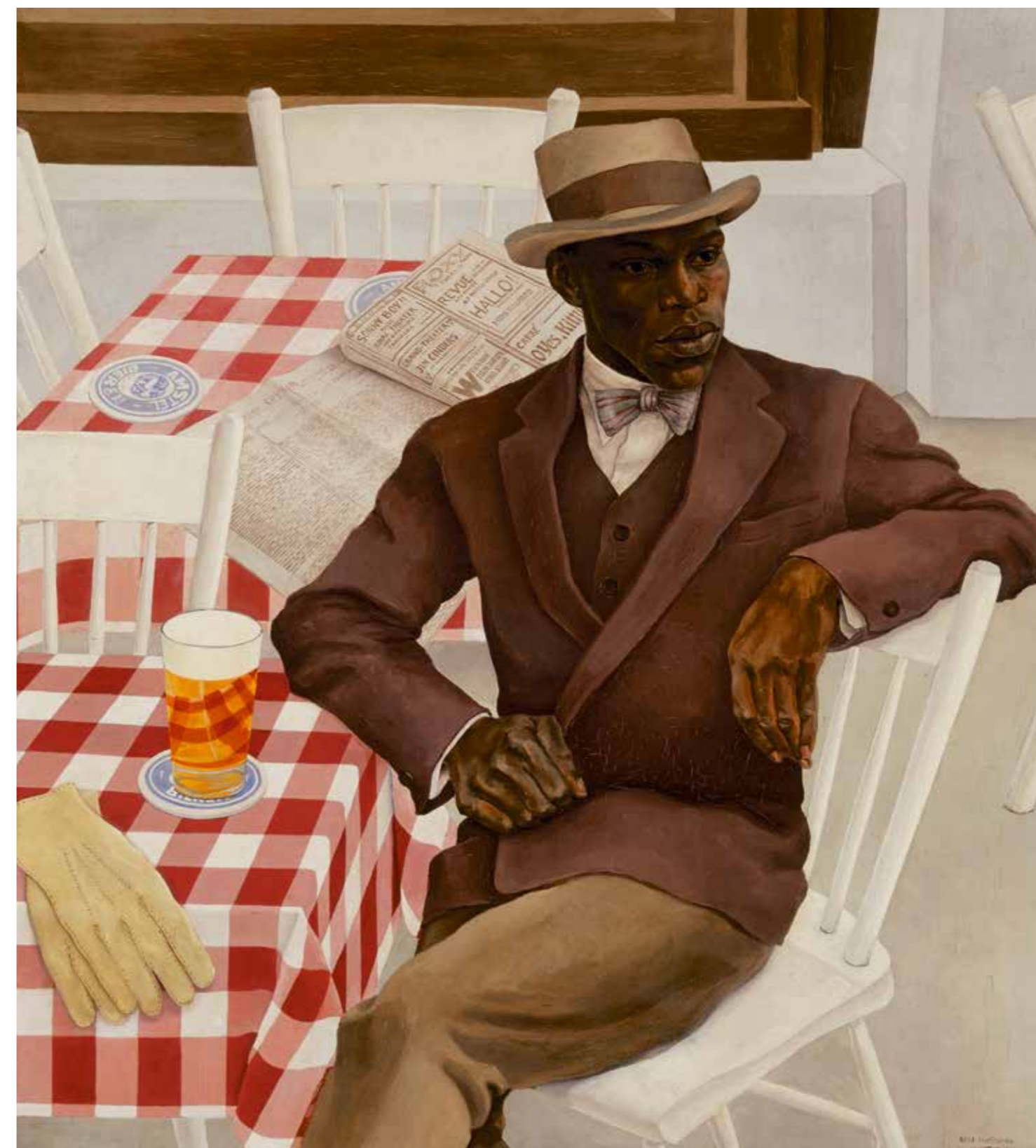
Louis Richard Drenthé / Op het terras olieverf op doek, 100 x 90 cm collectie Stedelijk Museum Amsterdam

Het portret van de zwarte man, in recensies omschreven als 'mondain' 3 en 'dandylike in Europeesch kostuum' 4 oogstte lof. 'Het groote portret van den man voor het café is zoowel in zijn expressie als door zijn compositie en kleurencombinatie een getuigenis van diepe innerlijke beschaving en goede smaak',