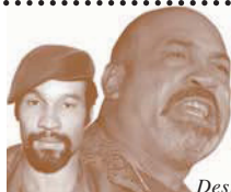
Desi Bouterse in 1982 en 2003

25 november 1975 Suriname wordt onafhankelijk van Nederland.