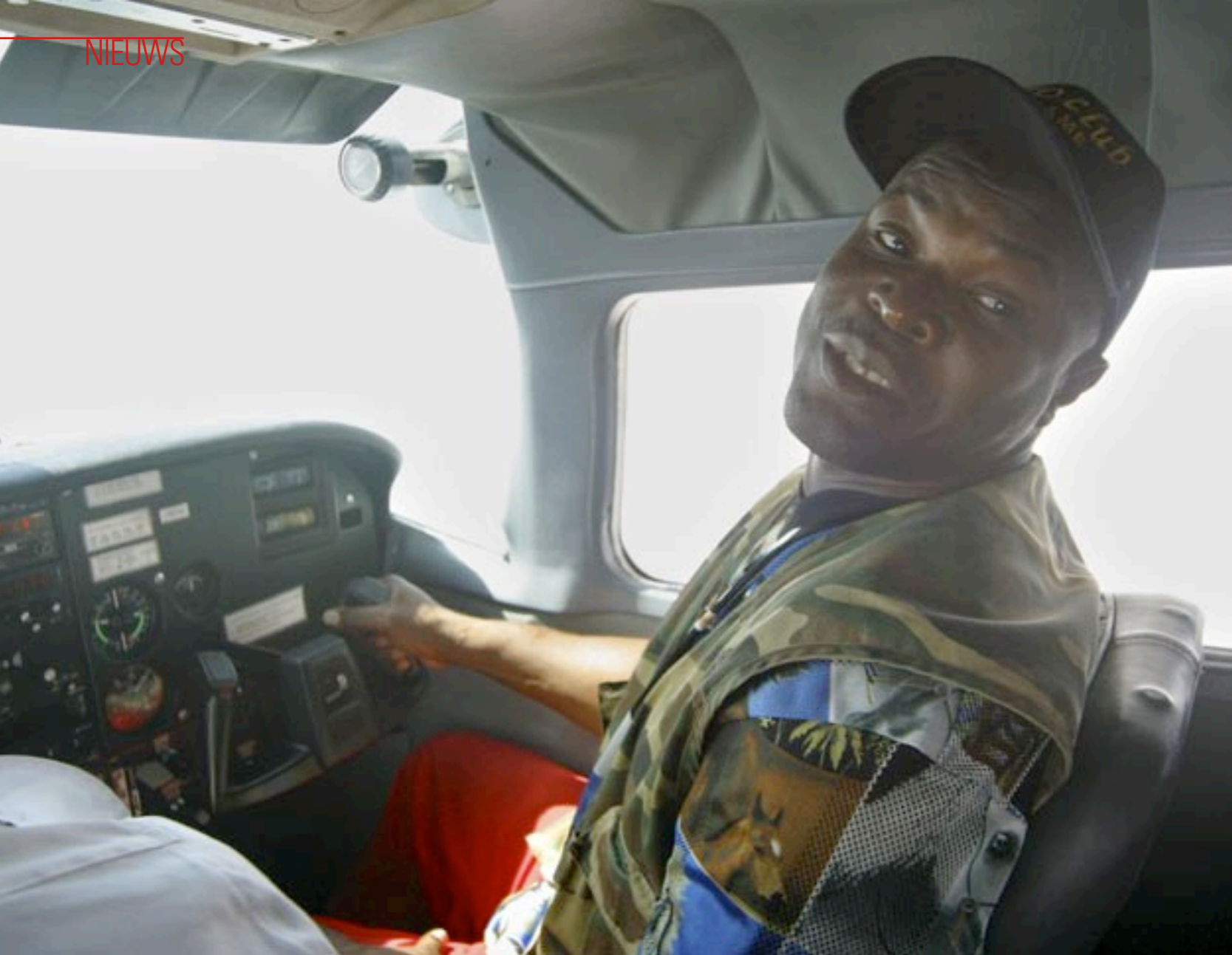
Links: op weg naar Brunswijks goudvelden. Hij mag zelf het vliegtuig besturen.