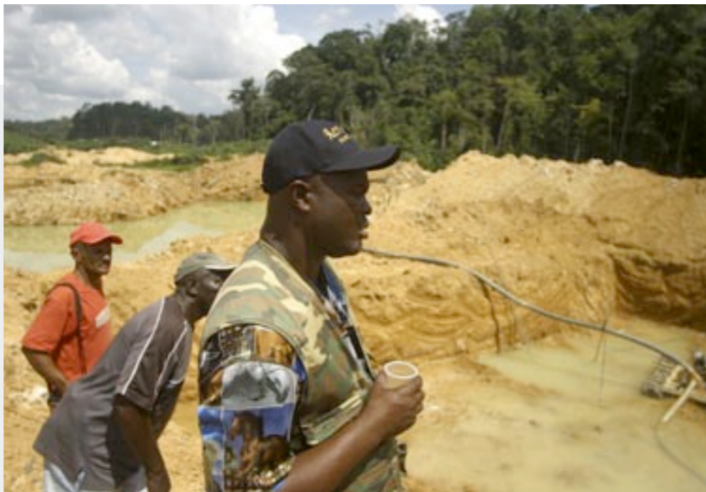
Boven: inspectie van de goudvelden. Brunswijk zou steenrijk zijn. Onder: het goudgebied aan de Sarakreek, diep in 'het bos'.

Binnenkort worden de 8-decembermoorden berecht. Er gaan stemmen op, vooral uit het kamp van Bouterse, voor een waarheidscommissie in plaats van een proces. Vermoedelijk in de hoop dat strafvervolging dan uitblijft. Brunswijk vindt: "Daarvoor is het te laat. Er moet een vonnis komen." Tijdens de Binnenlandse Oorlog richtte het leger ook een bloedbad aan in het marrondorpje Moiwana (zie Nieuwe Revu van vorige week). Bijna veertig dorpeelingen, veel kleine kinderen en zeker drie zwangere vrouwen werden doodgeschoten. Sinds de uitspraak van het Inter-Amerikaanse Hof te Costa Rica dit jaar is Suriname veroordeeld tot het doen van onderzoek hiernaar. Ook wat betreft de Binnenlandse Oorlog waar meer mensenrechtenschendingen passeerden, gaan stemmen op voor een waarheidscommissie. Brunswijk heeft daarop niet veel commentaar. Hij is tegen, maar waarom is niet helemaal duidelijk. Misschien vreest hij dat ook mensenrechtenschendingen door het Jungle Commando aan het licht komen?