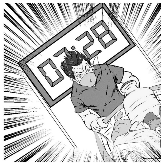
Illustratie Desmond Kerk

Na anderhalf uur onderweg komt hij aan bij de winkel in Paramaribo-Zuid, waar een rij van ruim negentig mensen staat. Het kolossale winkelpand is helemaal beveiligd met traliwerk en kogelvrij glas. Er is een ingang en de uitgang is aan de andere kant. Zwaarbewapende bewakers houden een oogje in het zeil. Het geheel voelt aan alsof je naar een concert gaat van een grote artiest of naar de finale van een belangrijke voetbalwedstrijd. Er zijn drie controleposten waar je temperatuur wordt gemeten en je steeds door een scanner moet om te checken of je geen wapens hebt. Er is een