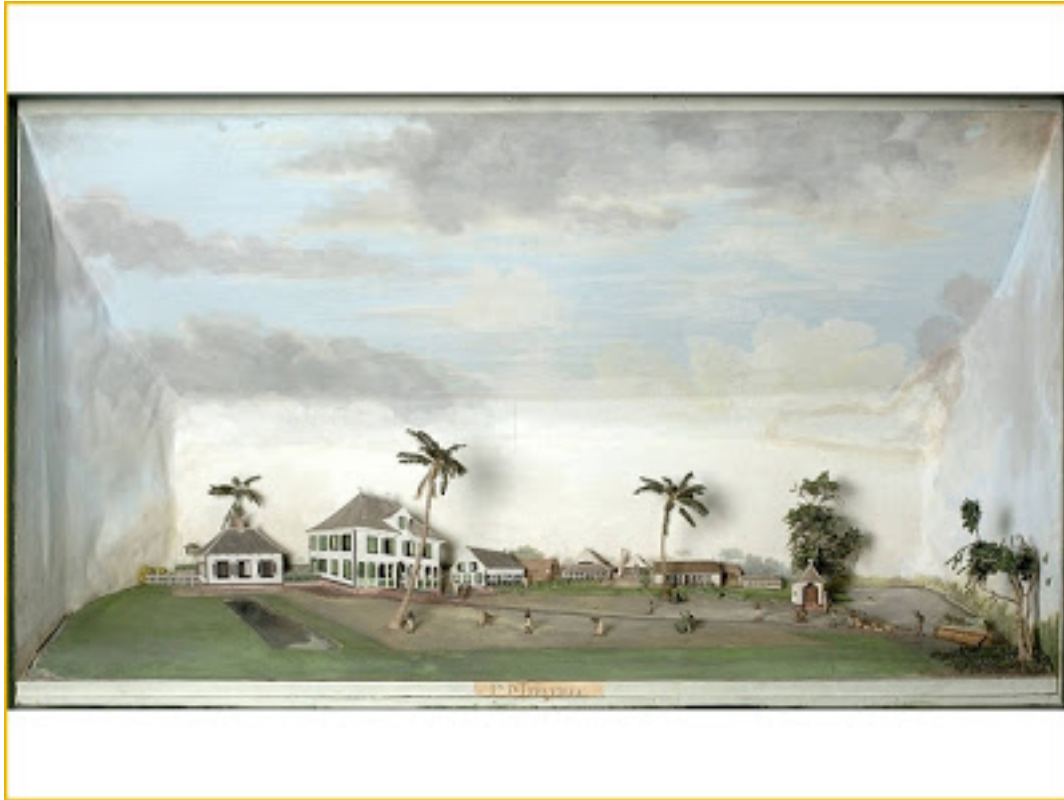
Suikerplantage Merveille. Diorama van Gerrit Schouten